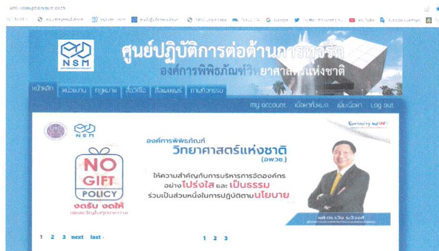
หน้าเว็บไซต์ ศปท.อพทช.