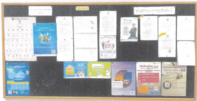
บอร์ดประชาสัมพันธ์ส่วนกลาง