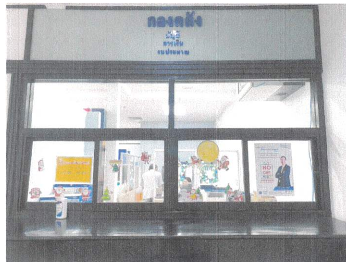
หน้าต่างกองการเงินและบัญชี