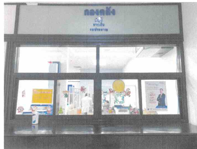
หน้าห้องกองการเงินและบัญชี