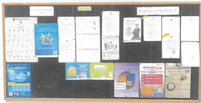
บอร์ดประชาสัมพันธ์ส่วนกลาง