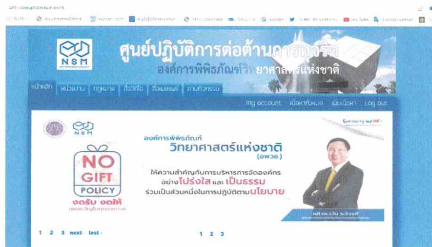
หน้าเว็บไซต์ ศปท.อพวช.